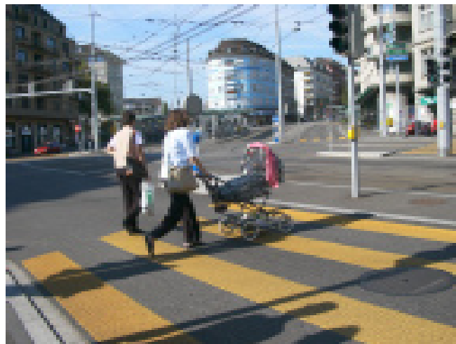
Precedenza assoluta sulle strisce pedonali. (Schaffhauserplatz a Zurigo)

A livello internazionale, ci siamo alleati con altre associazioni di pedoni in Europa, curiamo i contatti con associazioni extraeuropee e appoggiamo le rivendicazioni portate avanti sul piano internazionale.