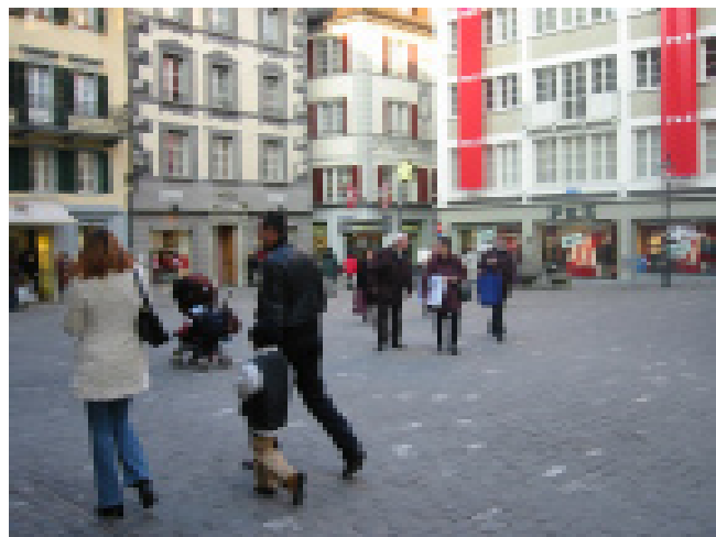
I pedoni "padroni della piazza" (Kornplatz)