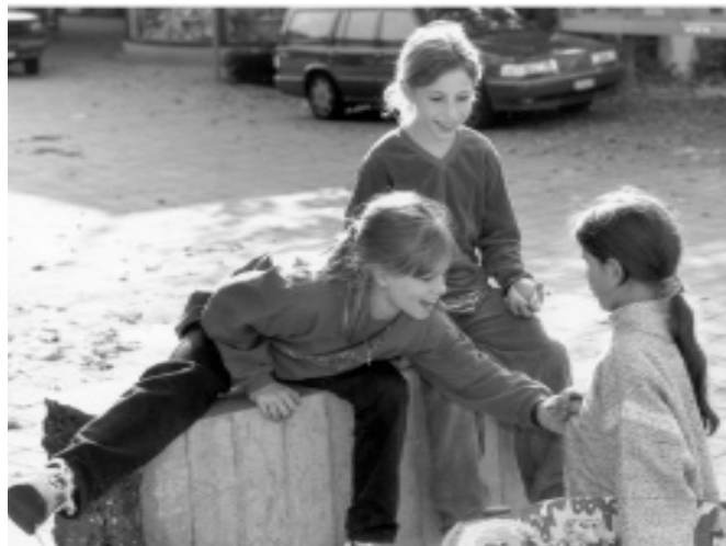
La strada pubblica è anche uno spazio vitale per i bambini.

Diamo degli impulsi per rivalutare la mobilità pedonale ed interveniamo a livello pratico e sul piano politico. Curiamo i contatti con i nostri soci e mettiamo l'accento sui temi che toccano la mobilità pedonale nell'ambito di campagne tematiche.