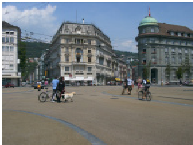
Nella zona d'incontro, la strada si tramuta in spazio per vivere e spostarsi a piedi. (Bienne Zentralplatz)